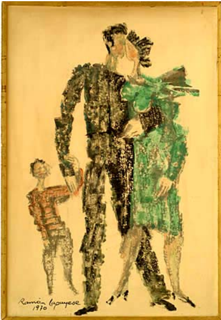
Familia, 1970. Óleo sobre papel en tablero

La pintura de Lapayese es la pintura de un escultor, del mismo modo que su escultura es la escultura de un dibujante